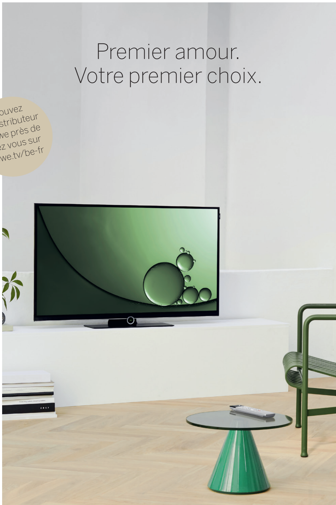
Loewe bild 1.49

Trouvez un distributeur Loewe près de chez vous sur loewe.tv/be-fr