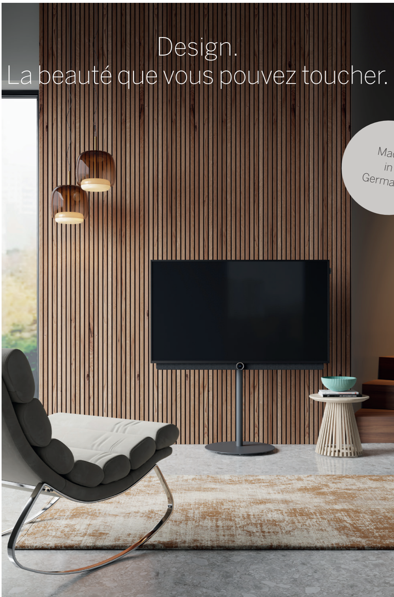
Loewe bild 3.55 OLED avec Loewe Floor Stand Universal 43-65

Ajoutez une note chaude et stylée à votre intérieur. Un design inspiré, des lignes claires et d'étonnantes combinaisons de matériaux. Discret et élégant. À la fois télévision, objet de design et système acoustique. Un système high-tech esthétique et élégant. Réalisé sur mesure pour les puristes.