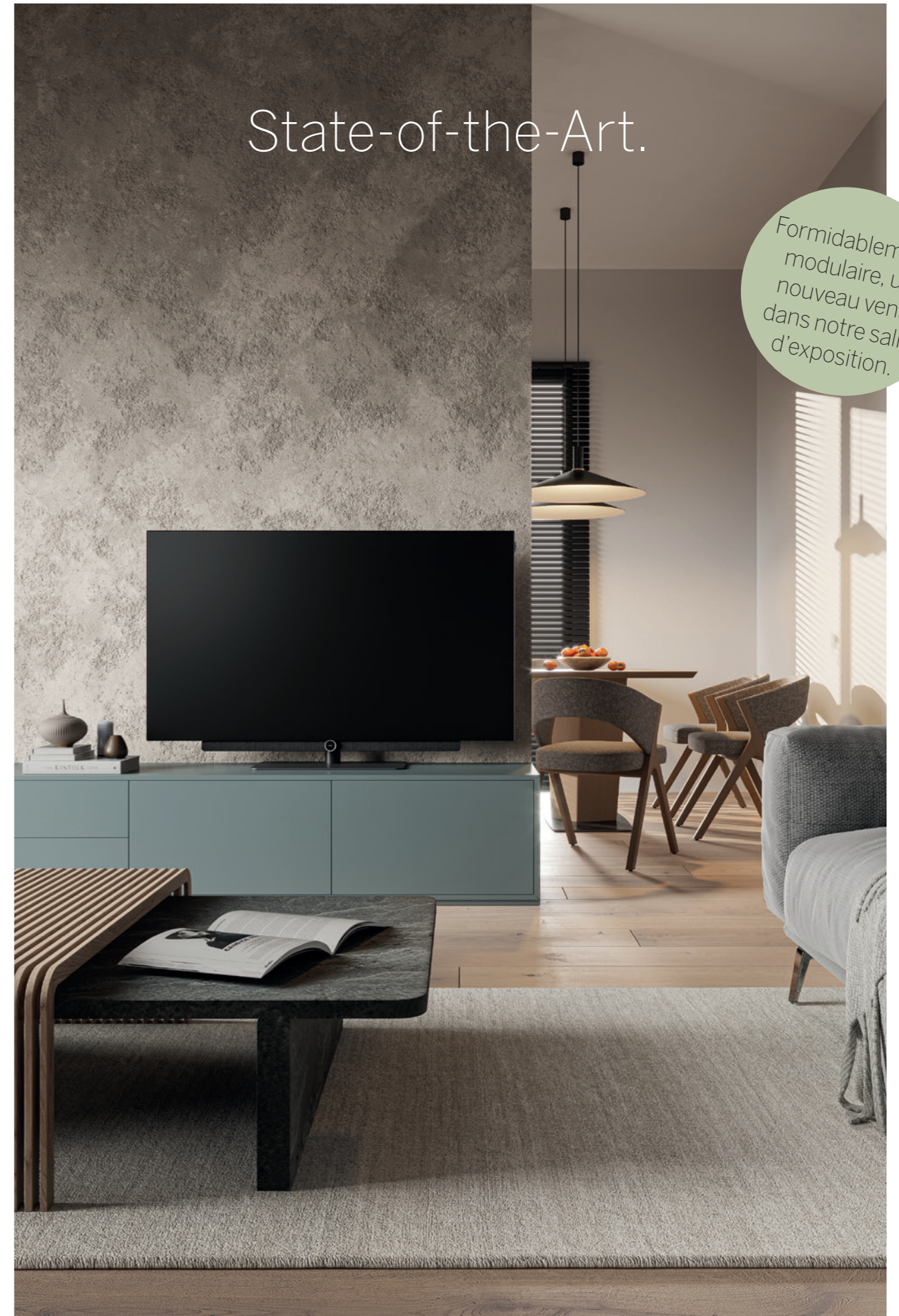
Loewe bild 5.55 OLED

Formidablement modulaire, un nouveau venu dans notre salle d'exposition.